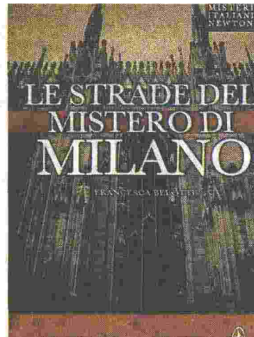
IN GIRO Le strade del mistero di Milano, Newton Compton